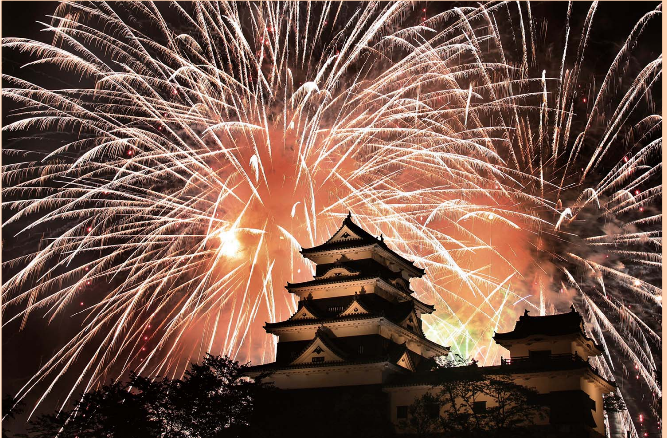
「大洲城と花火」(大洲市)